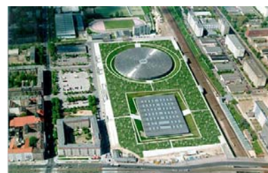
[1][2] Het Velodrome te Berlijn.

Waar in Berlijn een zekere ingetogenheid een belangrijk element in de uitstraling van het gebouw is, spelen bij de uitbreiding en renovatie van het Luxemburgse paleis van justitie hele andere uitgangspunten een rol. Perrault laat daarmee zien dat hij het belangrijk vindt om locatiespecifiek te werk te gaan.