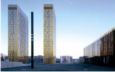
[4] Het justitiele hof in Luxemburg.

De bouw van hoge kantoorgebouwen of woontorens vormt een steeds belangrijker deel van de orderportefeuille vertelt Perrault. Gezien zijn internationale doorbraak begin jaren negentig met de bouw van de Nationale bibliotheek, lijkt dat niet verwonderlijk. Perrault ontwierp een rechthoek van ongeveer 60.000 m 2 , waarvan de hoeken worden gevormd door vier L-vormige torengedebouwen, met een park van circa 12.000 m 2 in het midden[5]. De hedendaagse prestatie om grote kantoor- en woongebouwen te mogen ontwerpen schuilt echter in het feit, dat inmiddels zelfs tot in Azië, Amerikaanse architectenbureaus in ontwerpwedstrijden worden verslagen. En dat terwijl Amerika onder velen nog steeds bekend staat om zijn voortrekkersrol in het ontwerpen van hoogbouw.