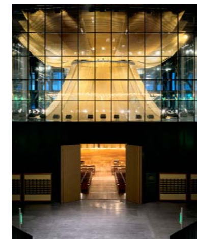
[3] Het justitieel hof in Luxemburg.

Om de rijkheid van de Europese Unie uit te stralen werden twee ranke 106 meter hoge kantoren gebouwd en voorzien van lichte en opvallende kleuren[4]. Ook werd hiermee een tegenwicht geboden aan het lokale klimaat. Om met Perrault te spreken: 'Het weer in Luxemburg is altijd slecht.'