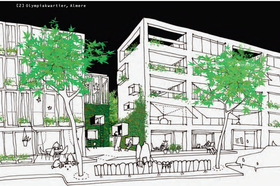
[2] Olympiakwartier, Almere