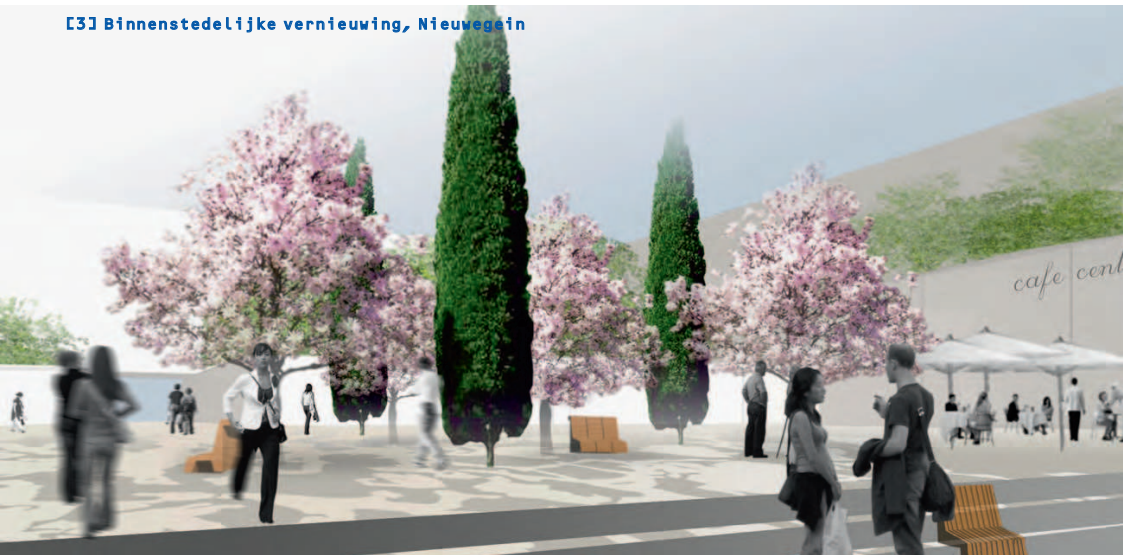
[3] Binnenstedelijke vernieuwing, Nieuwegein