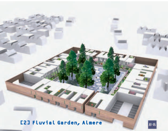
[2] Fluvial Garden, Almere